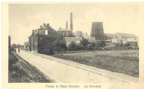
Fexhe le Haut Clocher La Sucrerie

Première mission réalisée au profit d'une commune, cet accompagnement se poursuit en collaboration étroite avec la SPI+.